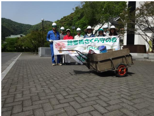
今月の活動メンバー